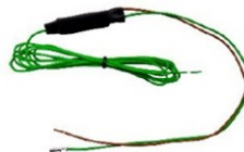
Převodník 12V - zem